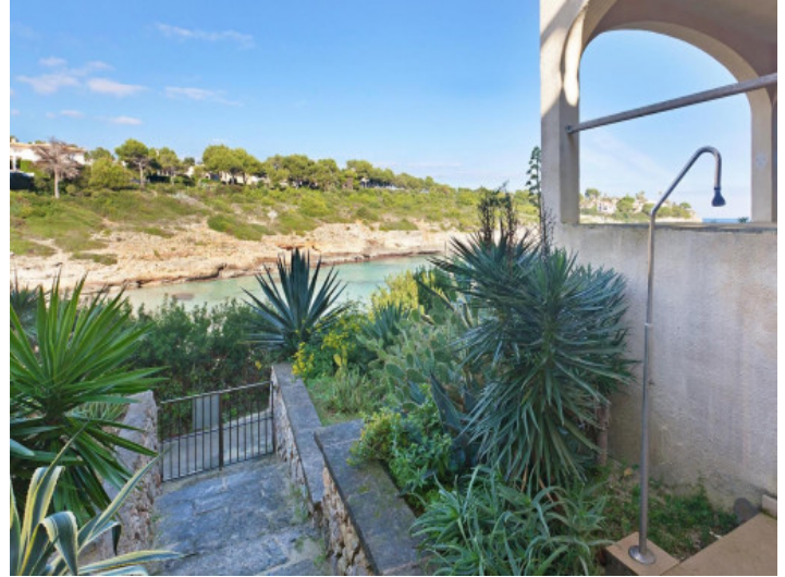
Acceso a la playa