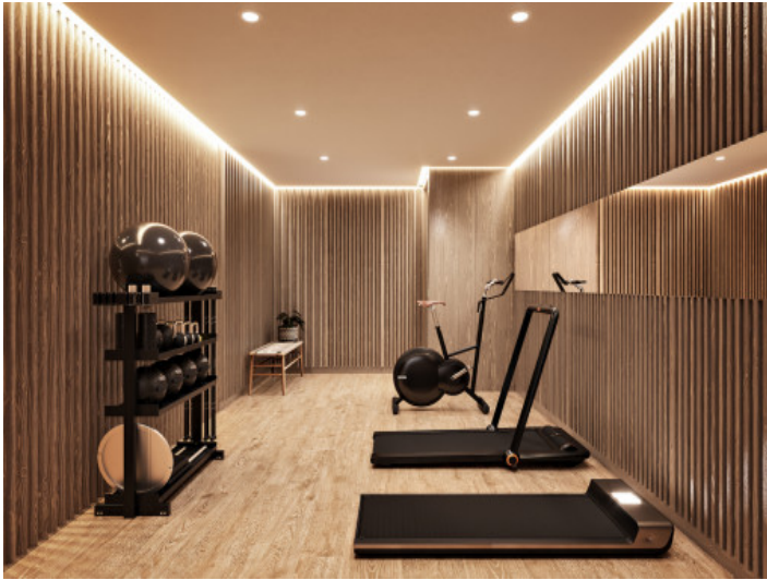
Gimnasio en zona comunitaria