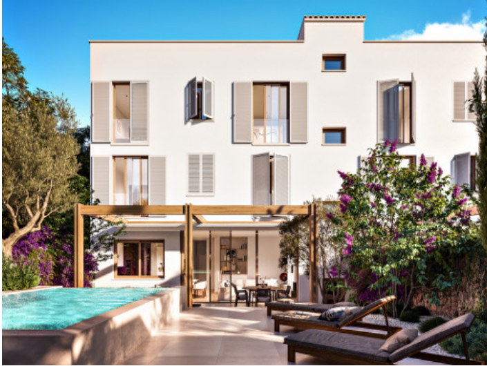
Jardín y piscina