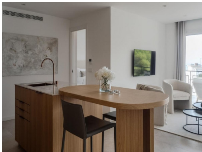
Salón abierto y comedor