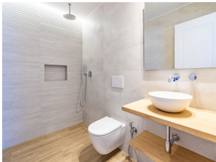
Baño con ducha