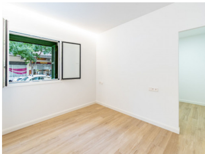
Uno de 2 dormitorios

Toda la información como mejor se puede saber, salvo por error durante el periodo de venta. Sirva este documento como un informe previo, las bases legales solo serán válidas a través de un contrato de compra acordado ante Notario.