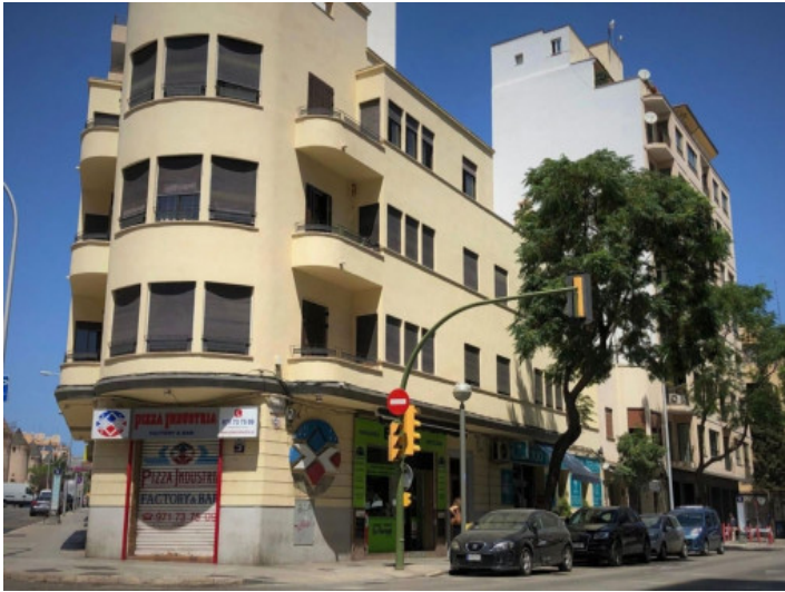
Piso con terraza privada en Santa Catalina en un edificio con carácter