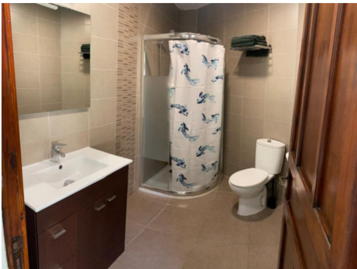
Piso con un baño con ducha