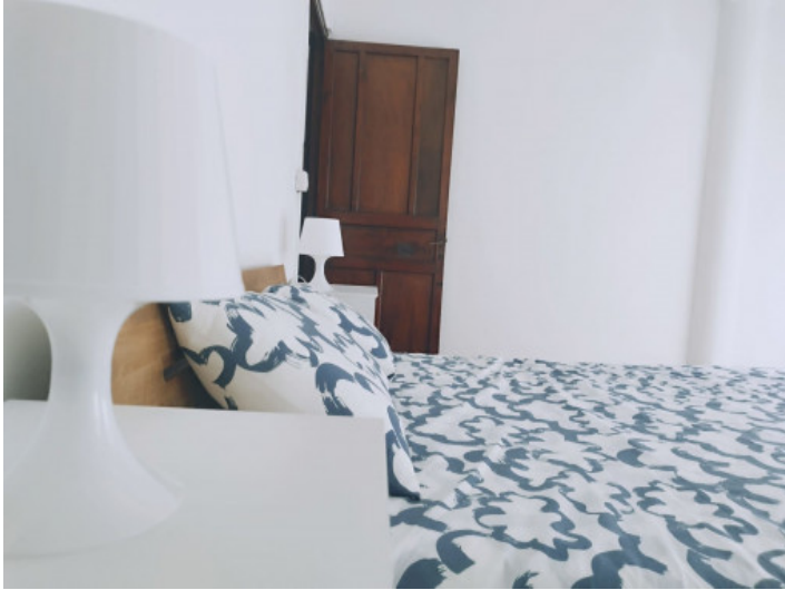
Uno de 4 dormitorios