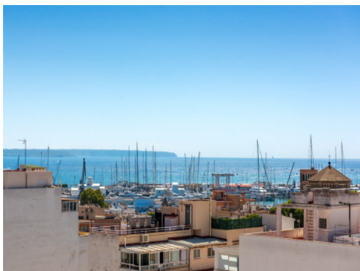
Vistas al mar mediterráneo