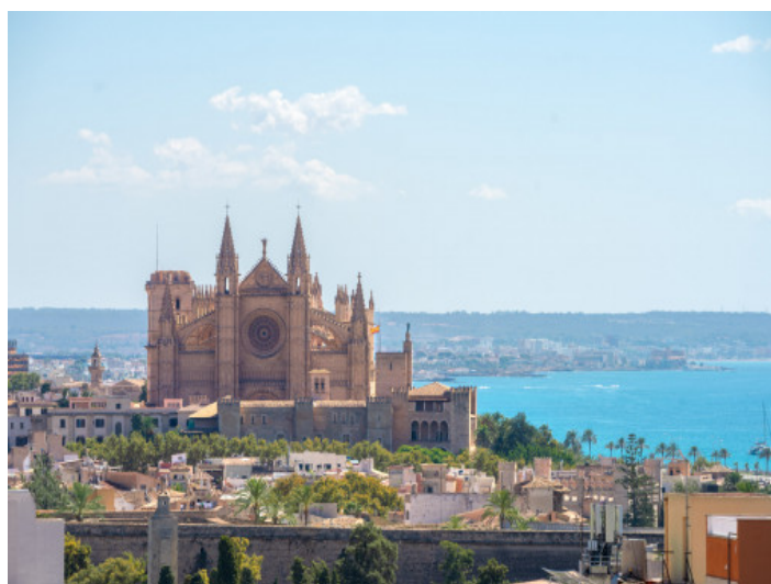
Vistas a la cathedral

Toda la información como mejor se puede saber, salvo por error durante el periodo de venta. Sirva este documento como un informe previo, las bases legales solo serán válidas a través de un contrato de compra acordado ante Notario.