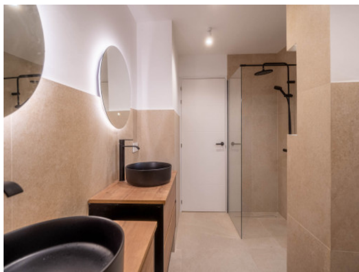
Baño con ducha