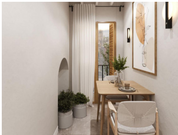
Rcibidor con comedor render