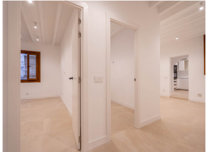
Vistas desde el pasillo a los 2 dormitorios