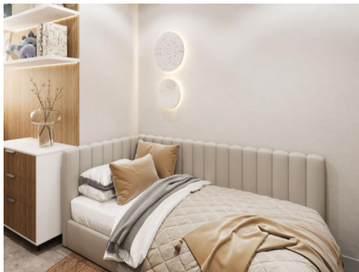
Segundo dormitorio render