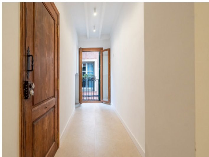
Recibidor con area de comedor