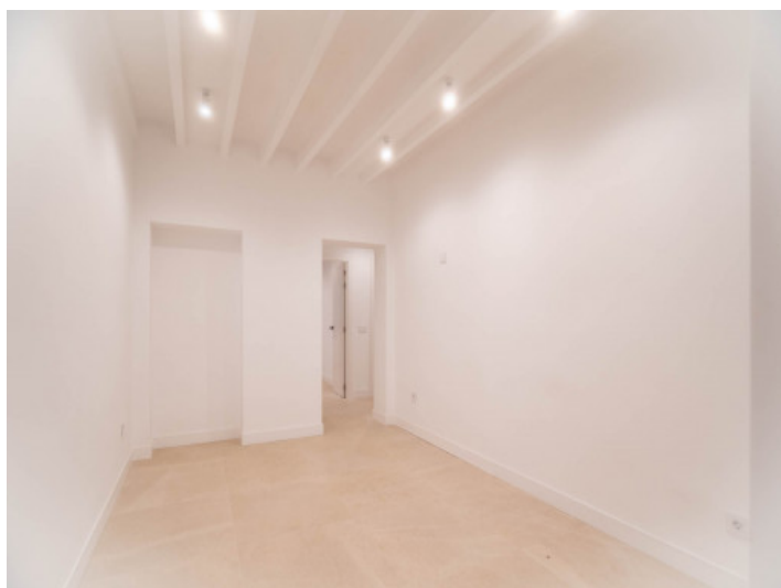
Recibidor con area de comedor