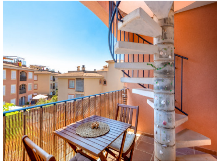
Balcón y escalera a la azotéa