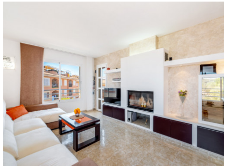
Salón con chimenea