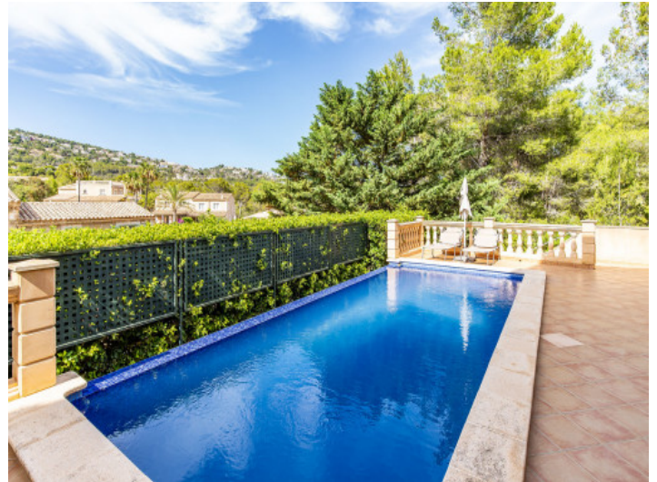
Lujoso piso con vistas panorámicas en Port Andratx