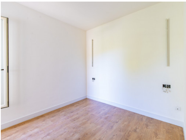
Uno de 2 dormitorios