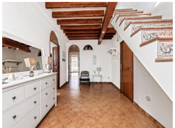
Subida al lounge

Toda la información como mejor se puede saber, salvo por error durante el periodo de venta. Sirva este documento como un informe previo, las bases legales solo serán válidas a través de un contrato de compra acordado ante Notario.