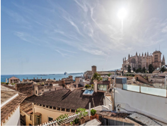
Vistas desde el lounge