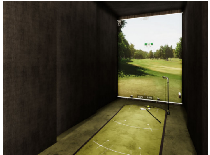
Simulador de golf