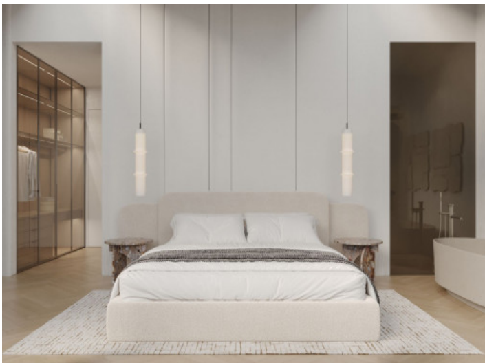
Uno de los 2 dormitorios