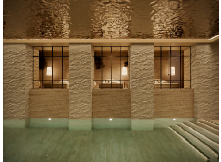
SPA y piscina cubierta