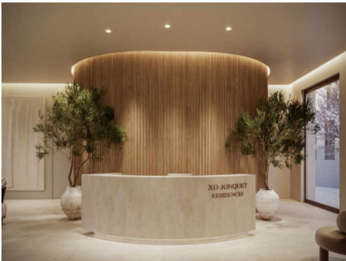
Área de entrada de la recepción