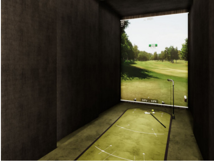
Simulador de golf