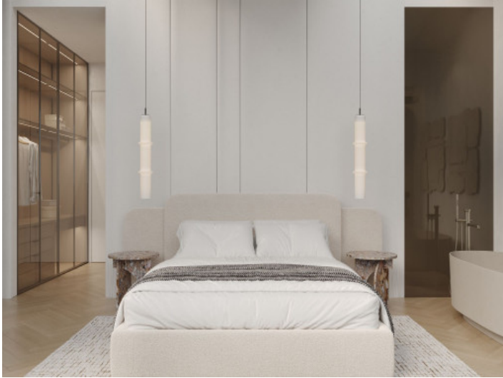
Uno de los 4 dormitorios