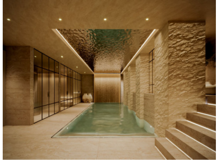
SPA y piscina