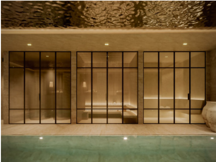
SPA y piscina