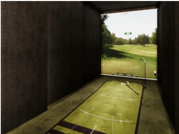
Simulación de golf