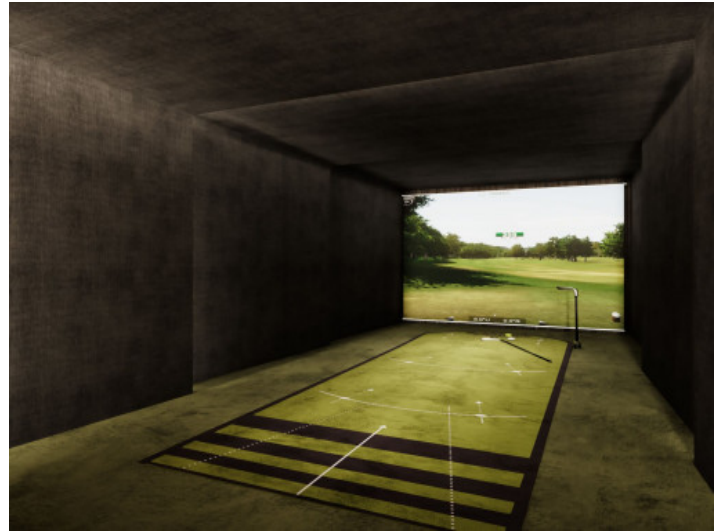
Simulador de golf