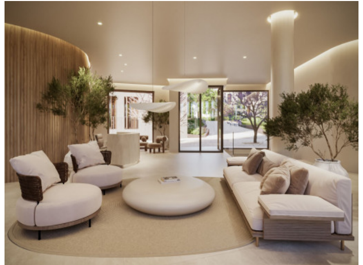
Salón en la recepción del edificio