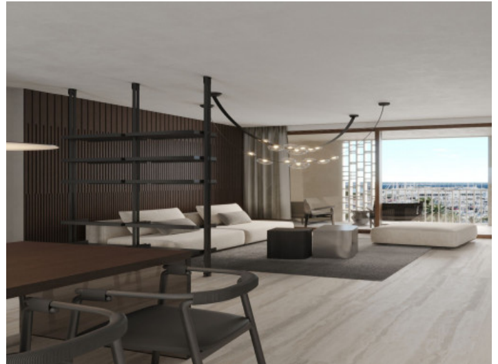
Salón con vista al puerto