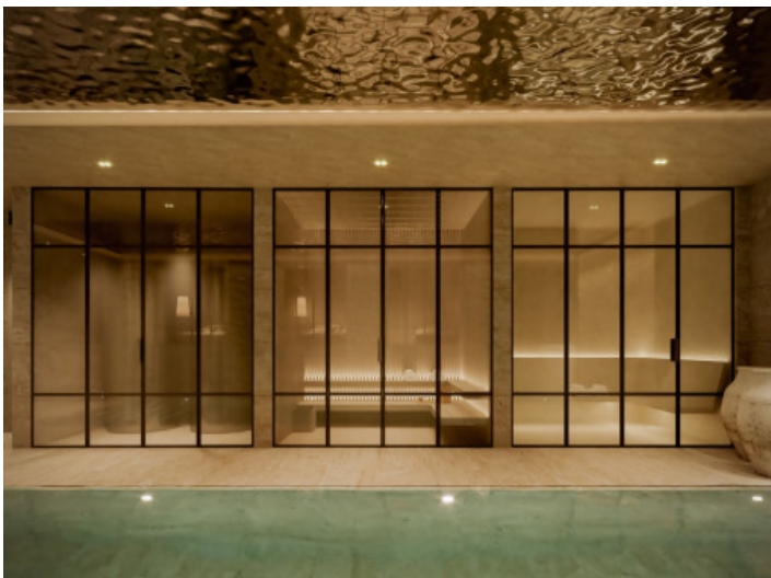
Spa y piscina cubierta