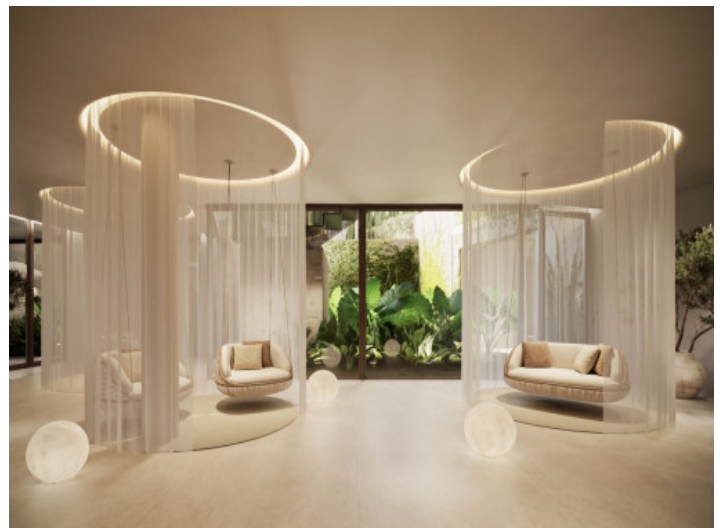
Recepción del spa

Toda la información como mejor se puede saber, salvo por error durante el periodo de venta. Sirva este documento como un informe previo, las bases legales solo serán validas a traves de un contrato de compra acordado ante Notario.