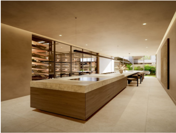
Bodega con club social