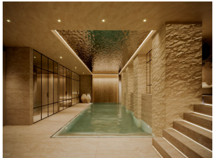
Spa y piscina cubierta