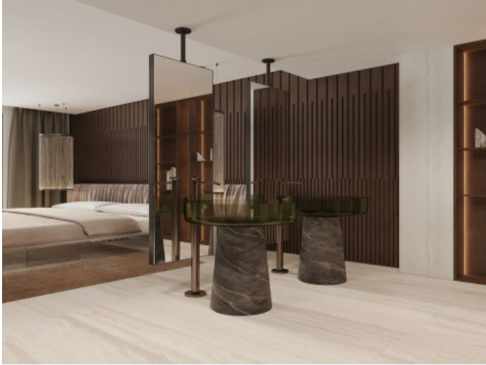
Uno de los tres dormitorios