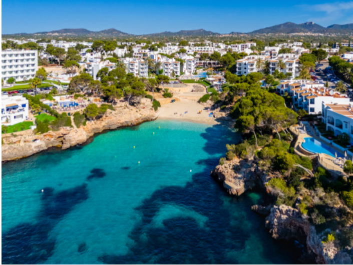
Playa cerca del piso