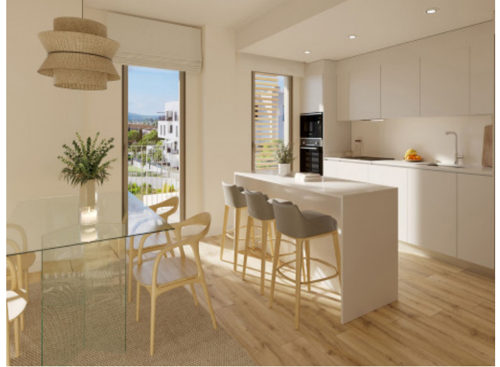
Comedor y cocina