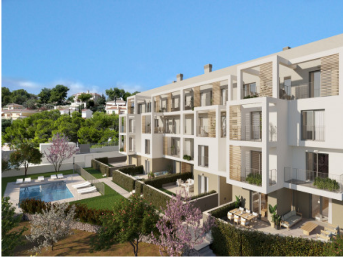
Vistas al complejo