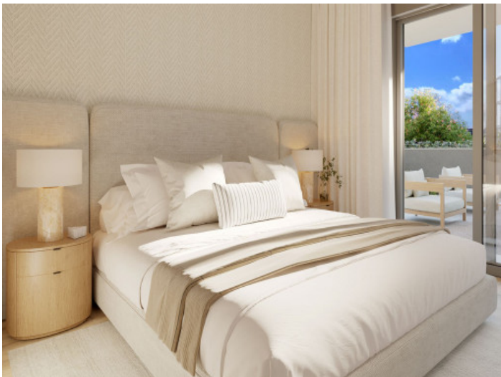
Uno de 3 dormitorios