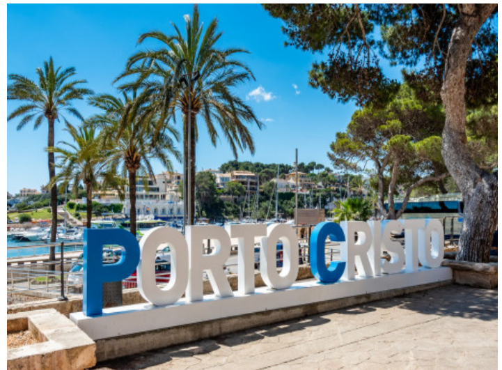
Paseo del puerto