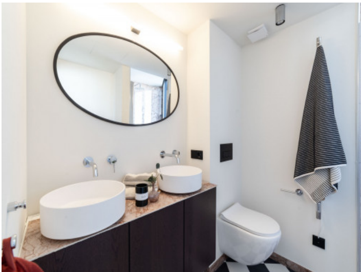
Baño en suite