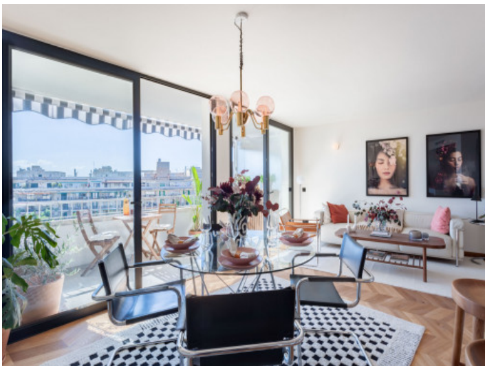
Salón - Comedor