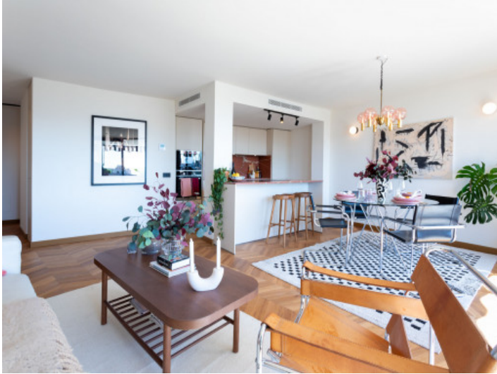
Salón - Comedor