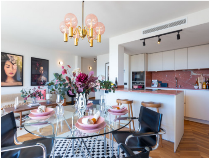
Salón - Comedor