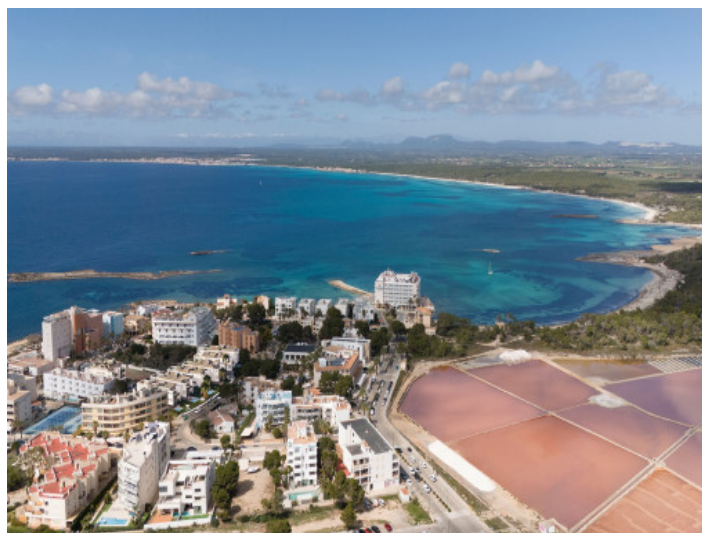
Colonia Sant Jordi

Toda la información como mejor se puede saber, salvo por error durante el periodo de venta. Sirva este documento como un informe previo, las bases legales solo serán validas a traves de un contrato de compra acordado ante Notario.