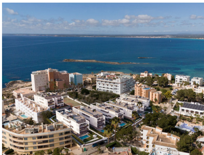
Colonia Sant Jordi