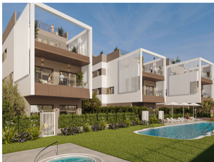
Fachada y piscina