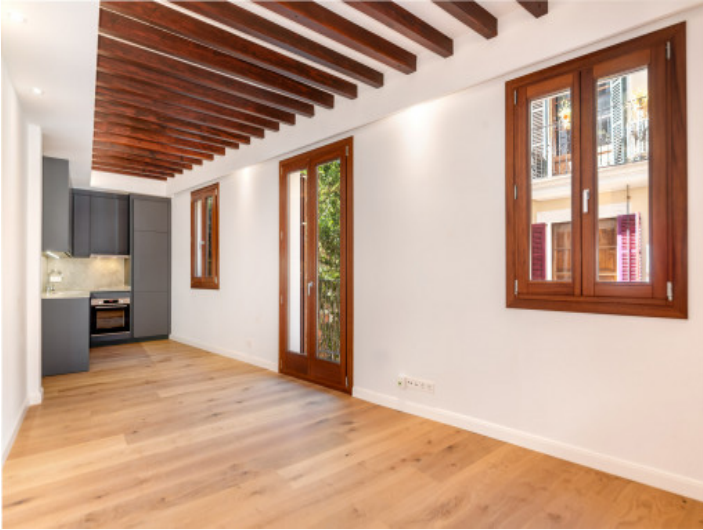
Salón - Comedor