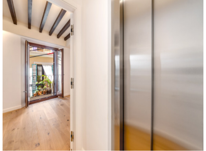
el ascensor llega directamente al piso