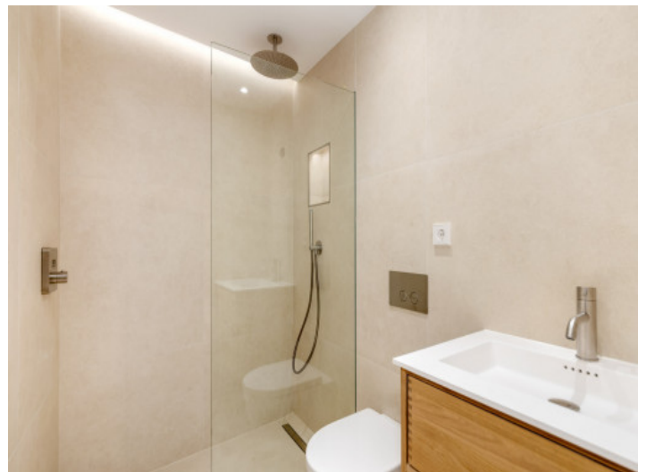
Baño con ducha

Toda la información como mejor se puede saber, salvo por error durante el periodo de venta. Sirva este documento como un informe previo, las bases legales solo serán válidas a través de un contrato de compra acordado ante Notario.