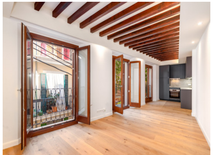
Living and dining

Toda la información como mejor se puede saber, salvo por error durante el periodo de venta. Sirva este documento como un informe previo, las bases legales solo serán válidas a través de un contrato de compra acordado ante Notario.