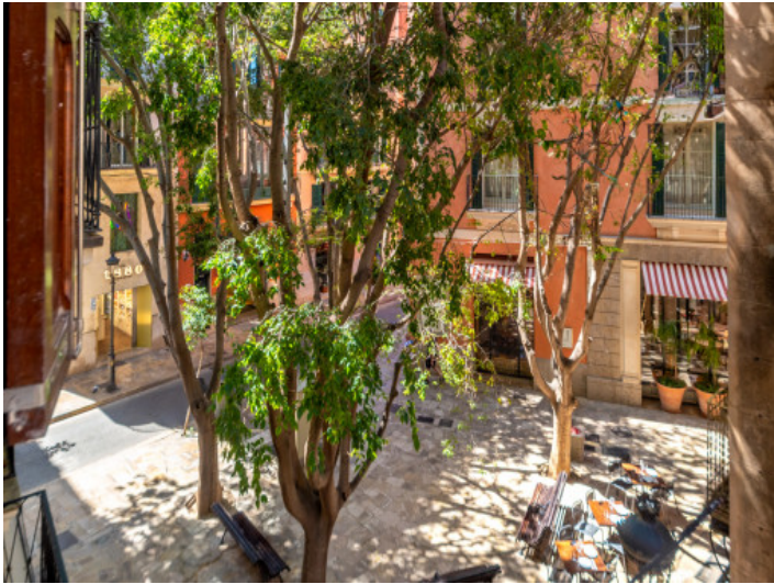
Vistas desde el piso