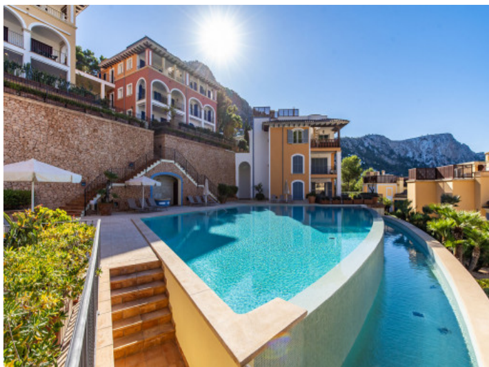
Piso con vistas al mar, terraza y piscina comunitaria en Puerto de Andratx