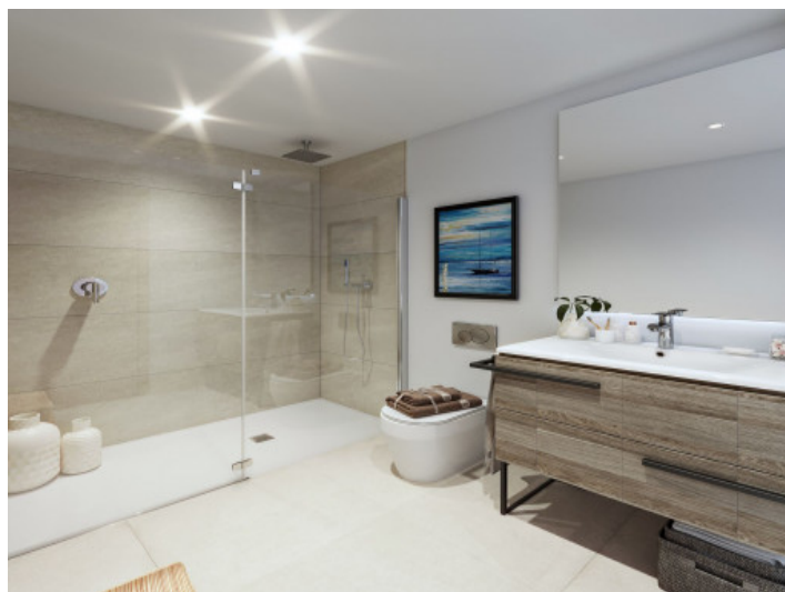
Baño en suite

Toda la información como mejor se puede saber, salvo por error durante el periodo de venta. Sirva este documento como un informe previo, las bases legales solo serán válidas a través de un contrato de compra acordado ante Notario.