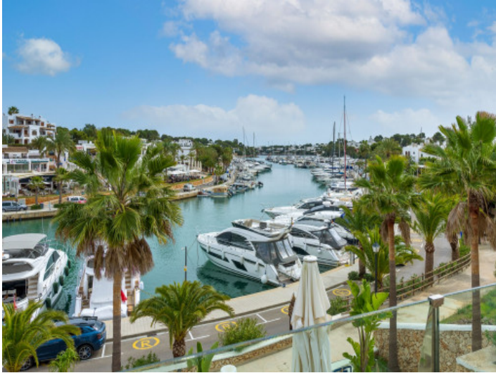
Vistas al puerto