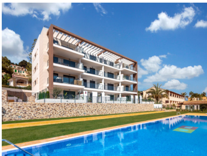
Complejo y piscina