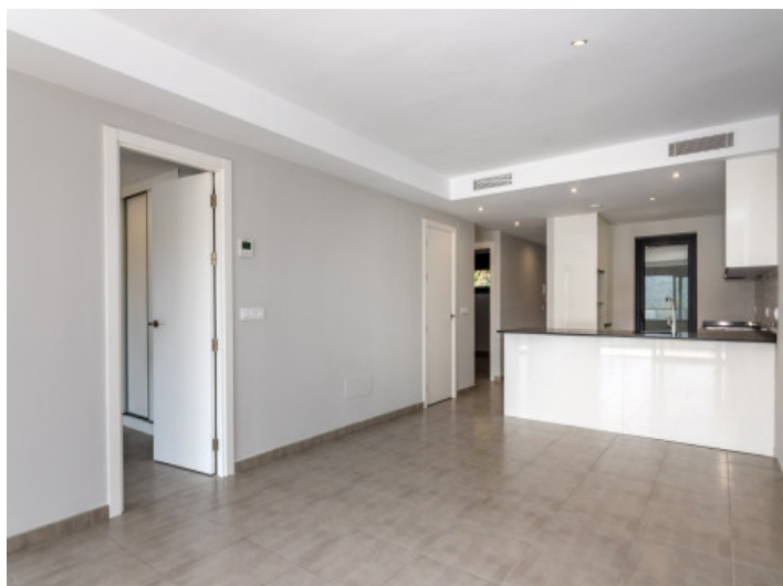
Salón y cocina