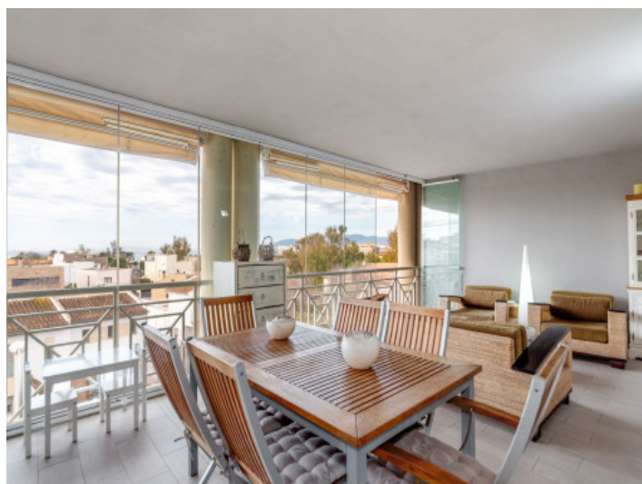
Jardín de invierno