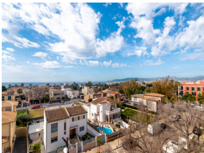
Vistas al mar