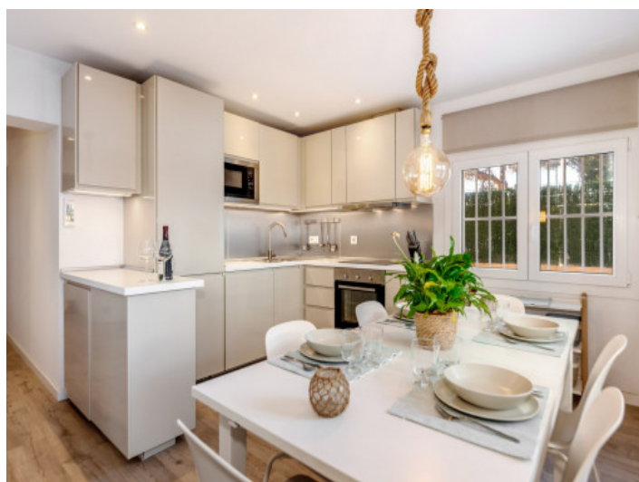
Comedor y cocina

Toda la información como mejor se puede saber, salvo por error durante el periodo de venta. Sirva este documento como un informe previo, las bases legales solo serán válidas a través de un contrato de compra acordado ante Notario.