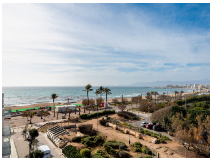
Vistas a la playa