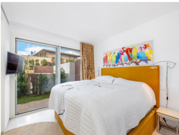
Dormitorio con baño en suite