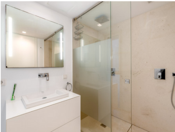
Segundo baño con ducha