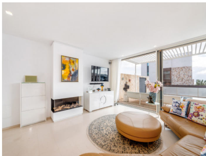
Salón con chimenea de gas

Toda la información como mejor se puede saber, salvo por error durante el periodo de venta. Sirva este documento como un informe previo, las bases legales solo serán válidas a través de un contrato de compra acordado ante Notario.