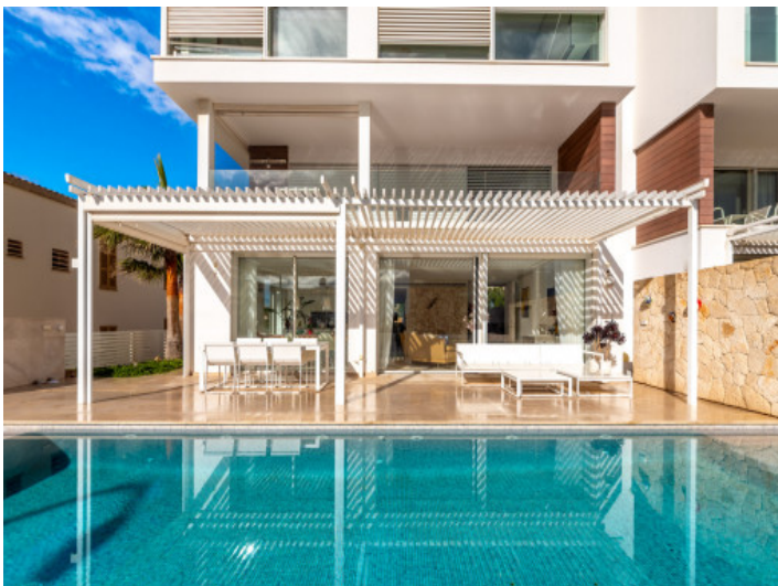
Un total de 5 unidades