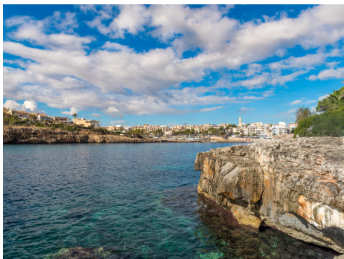
Cerca del puerto