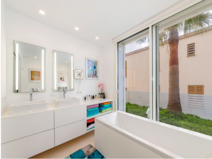
Baño con bañera