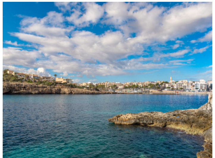
Puerto y playa

Toda la información como mejor se puede saber, salvo por error durante el periodo de venta. Sirva este documento como un informe previo, las bases legales solo serán válidas a través de un contrato de compra acordado ante Notario.