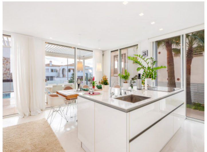
Cocina con isla