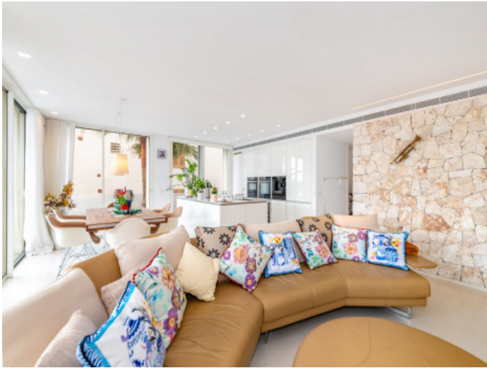
Pared de piedra vista