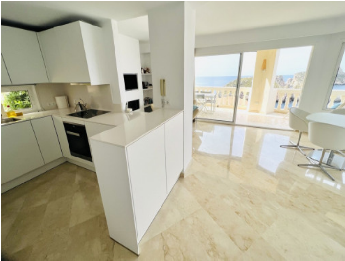
Salón con cocina