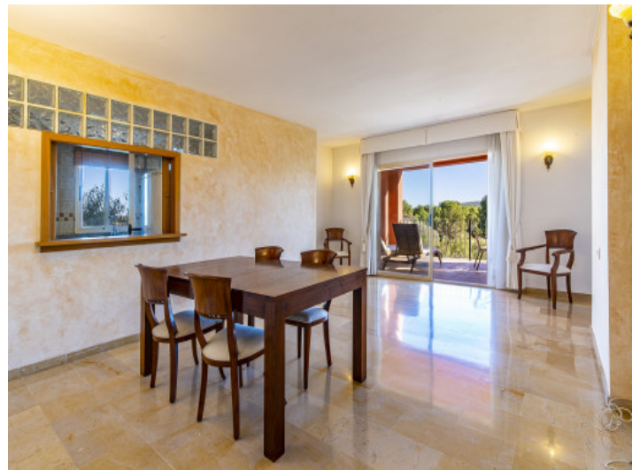
Comedor y salón