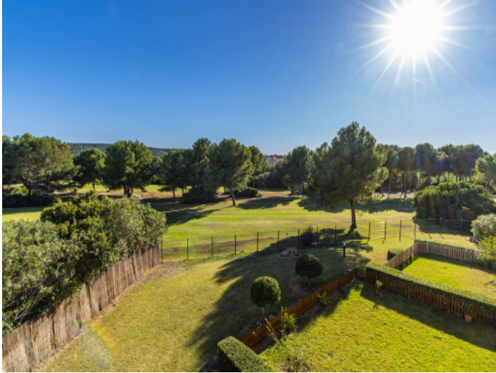
Vistas al campo de golf