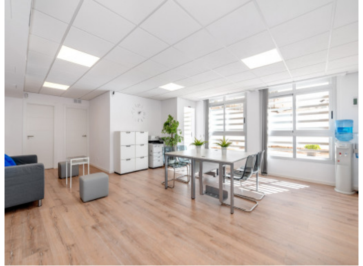
Zona de estar