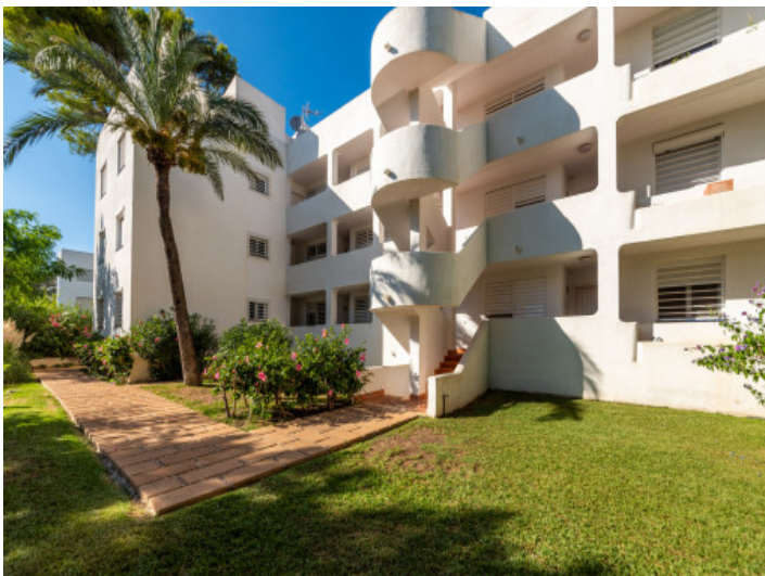
Jardín y edificio