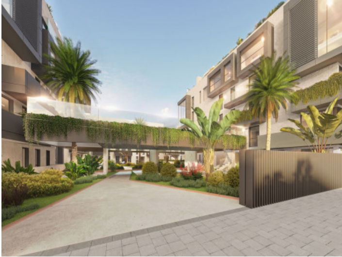
Acceso al complejo