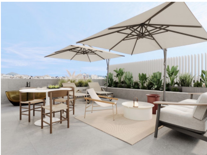
Azotea equipada con muebles