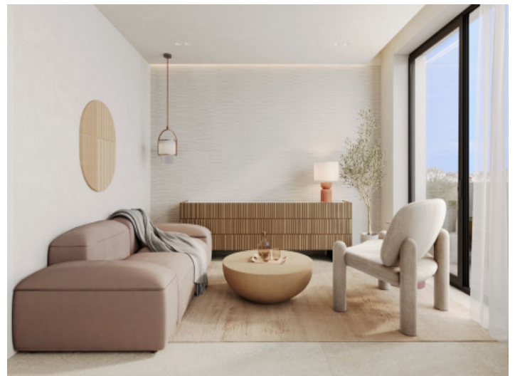
Luminosa sala de estar

Toda la información como mejor se puede saber, salvo por error durante el periodo de venta. Sirva este documento como un informe previo, las bases legales solo serán válidas a través de un contrato de compra acordado ante Notario.