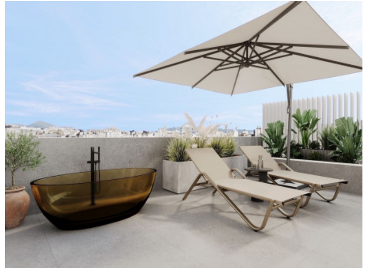
Terraza privada en la azotea