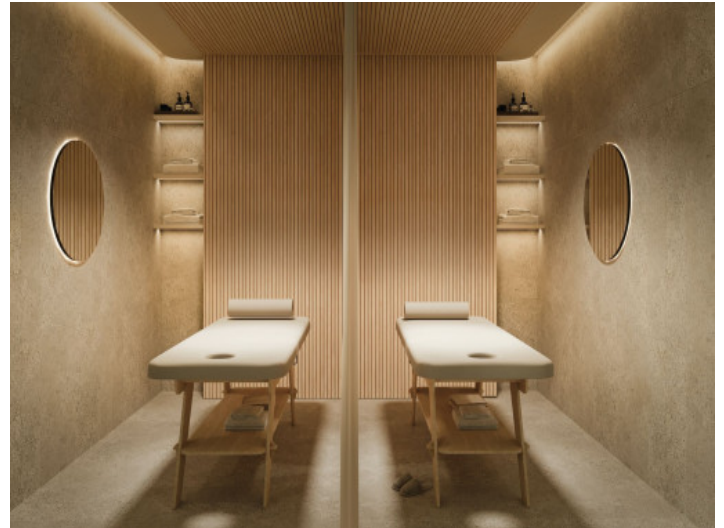
Sala de masajes