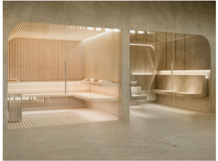
Zona de spa