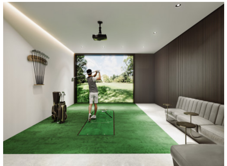
Simulador de golf

Toda la información como mejor se puede saber, salvo por error durante el periodo de venta. Sirva este documento como un informe previo, las bases legales solo serán válidas a través de un contrato de compra acordado ante Notario.