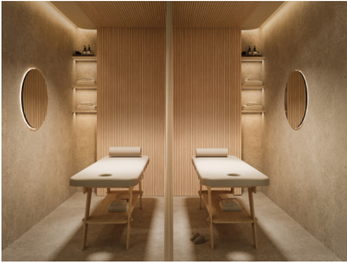
Sala de masaje