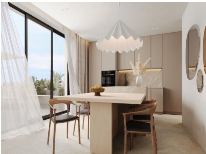
Cocina y comedor