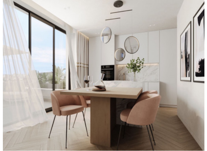
Cocina y comedor