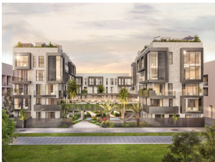
Piso lujoso a estrenar con parque en Nou Llevant