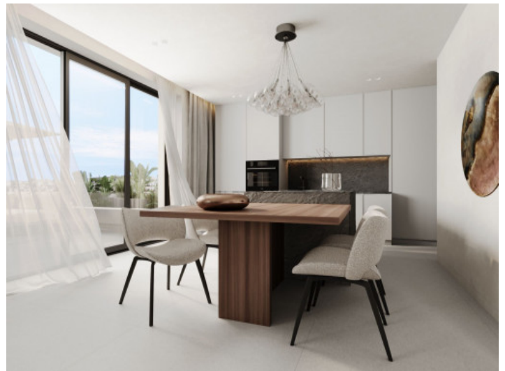
Cocina y comedor