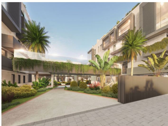
Acceso al complejo