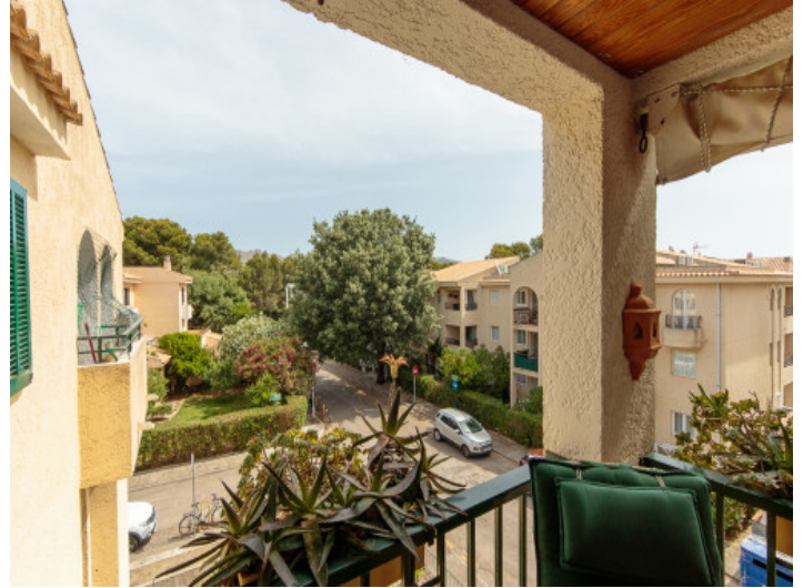
Vista desde la terraza