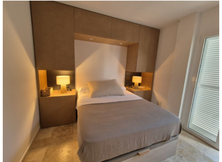
Uno de 3 dormitorios