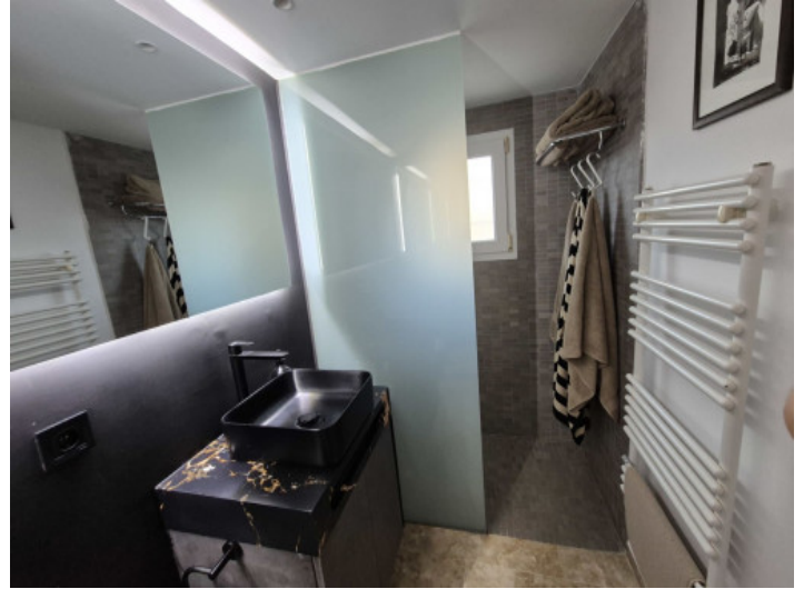
Uno de 2 baños