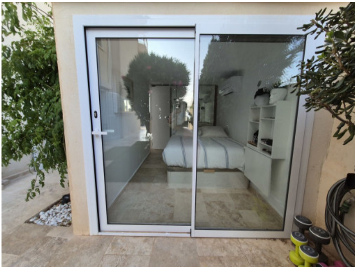
Dormitorio con acceso directo al jardín