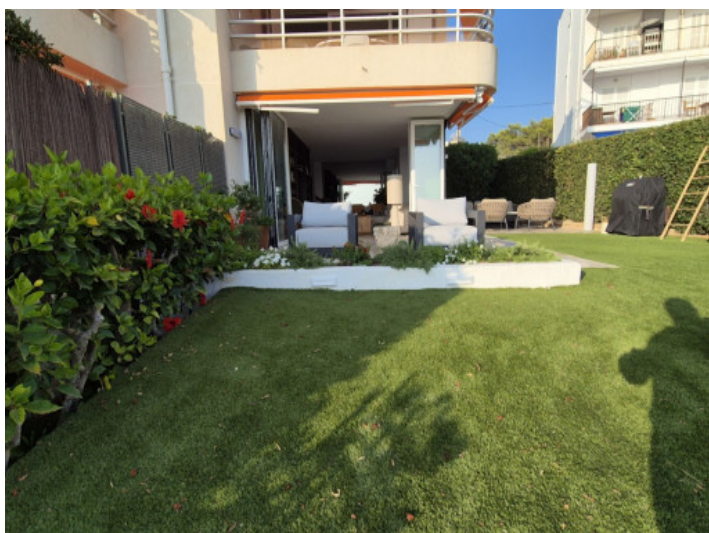
Terraza cubierta y jardín