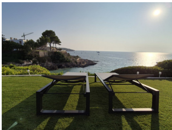
Fantásticas vistas al mar