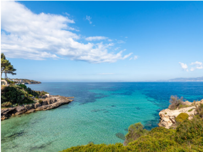
Primera línea del mar