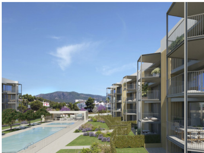
Apartamento de nueva construcción en Palmanova