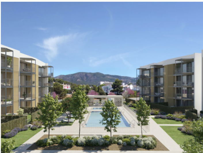
Vista a la piscina