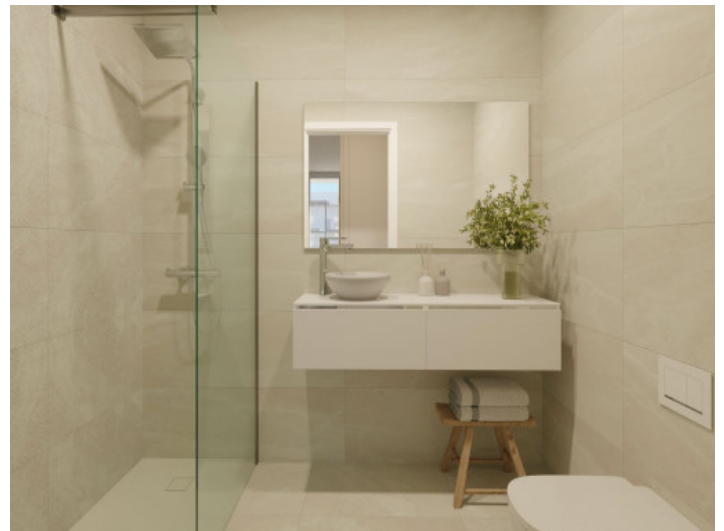
Baño con ducha a nivel del suelo