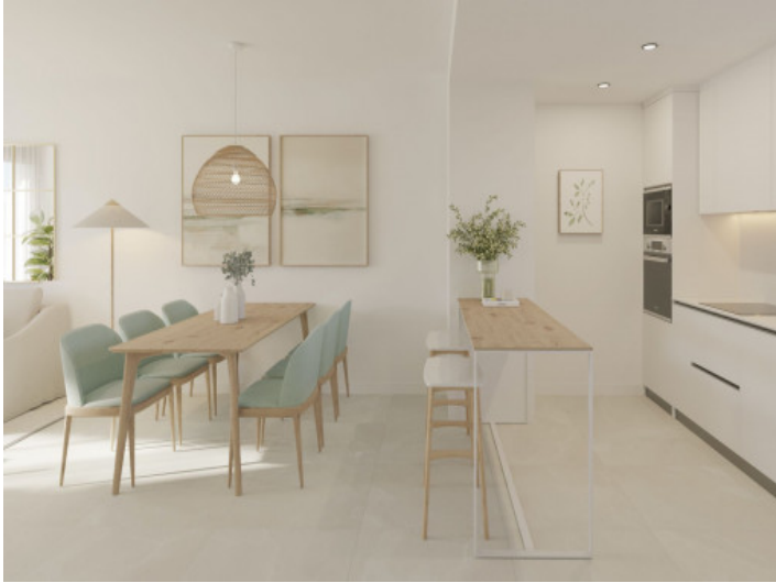
Salón con cocina abierta