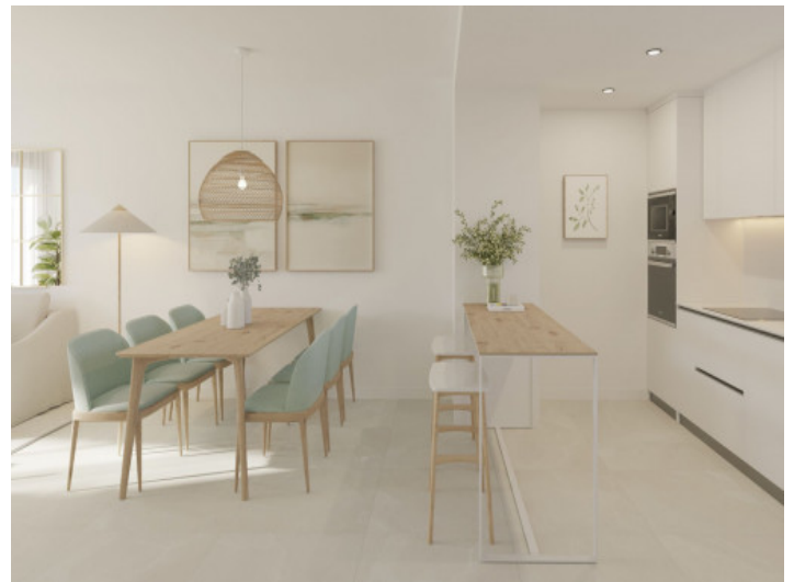
Salón con cocina abierta