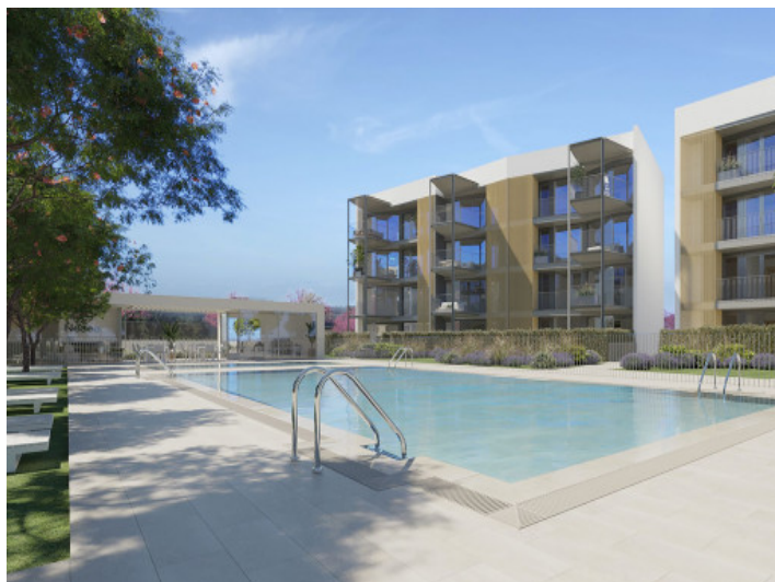
Vista a la piscina