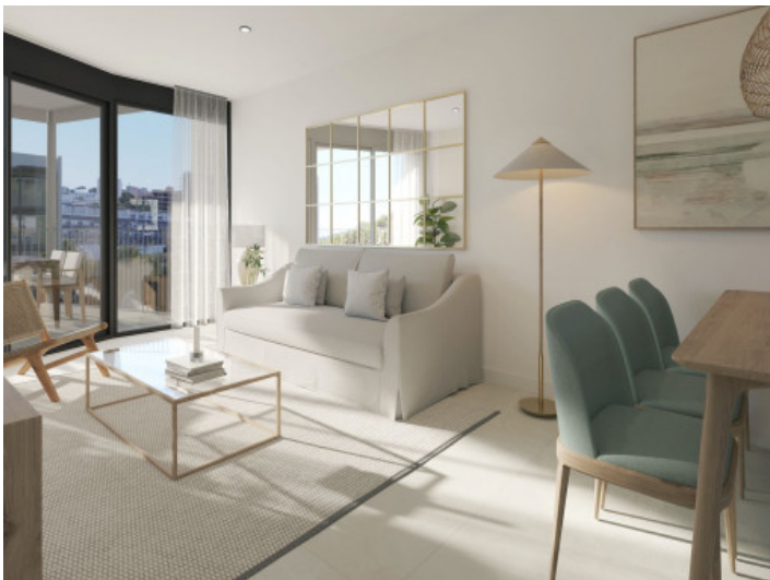
Salón inundado por luz natural