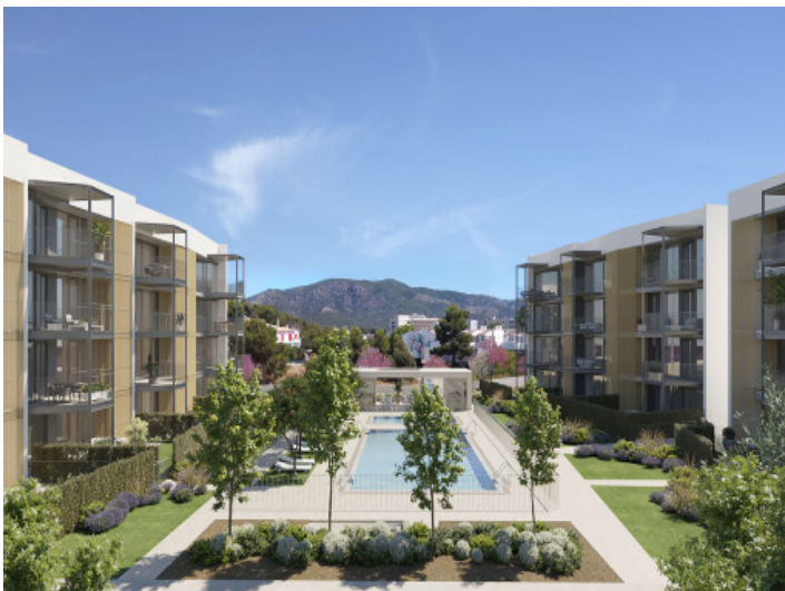
Vista al complejo