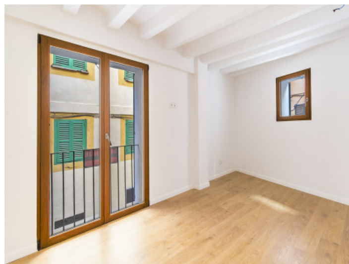
Vista al dormitorio