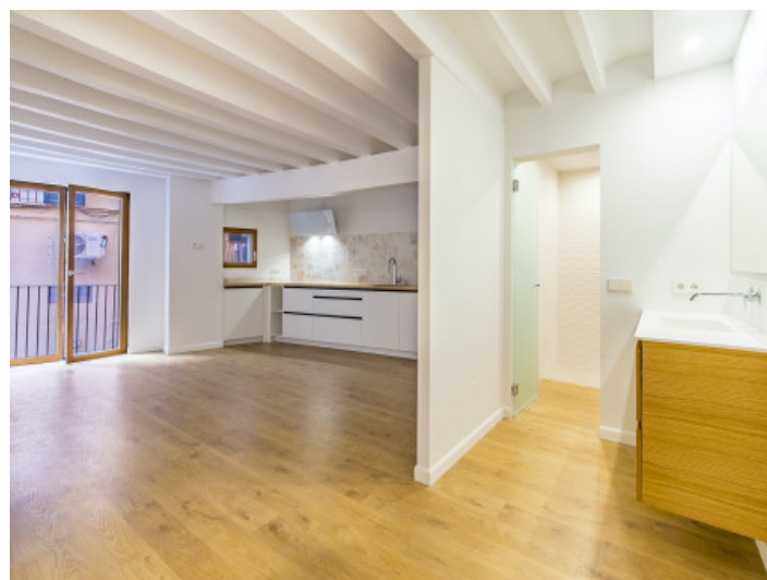
Salón y cocina abierta