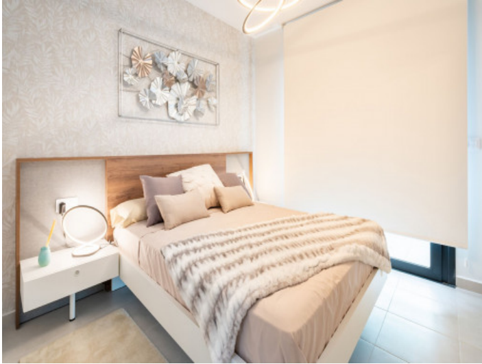
Uo de 2 dormitorios