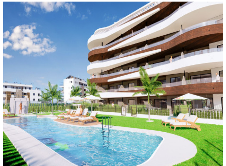
Complejo y piscina

Toda la información como mejor se puede saber, salvo por error durante el periodo de venta. Sirva este documento como un informe previo, las bases legales solo serán válidas a través de un contrato de compra acordado ante Notario.