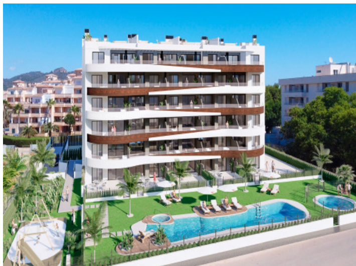
Complejo y piscina