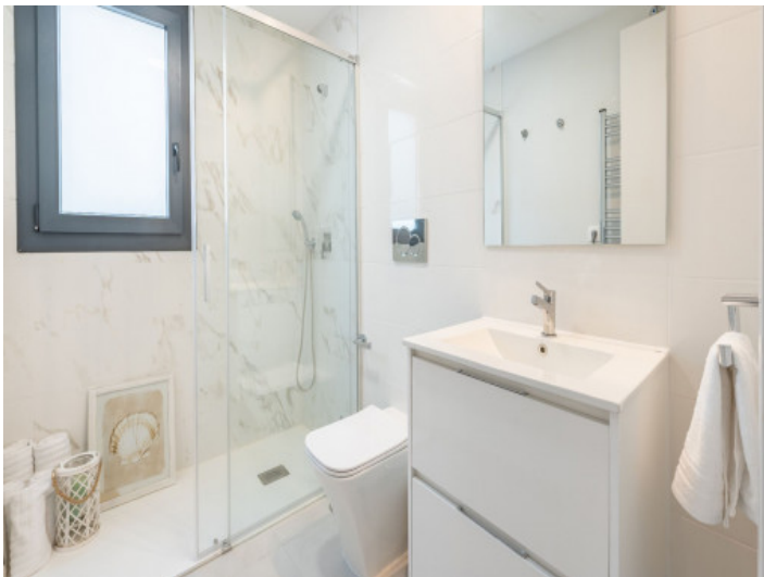
Piso con 2 baños