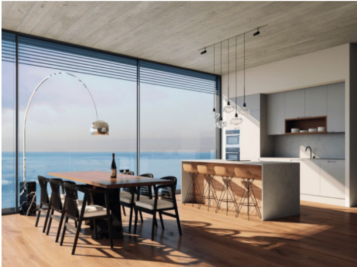
Comedor y cocina