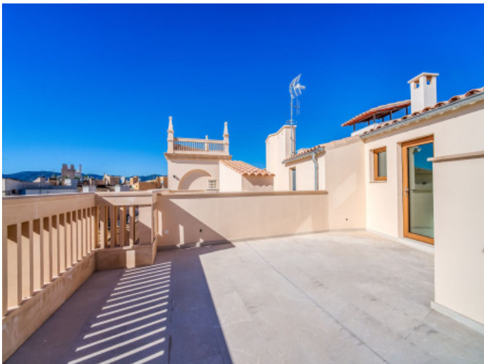
Ático esplendido con azotea en Palma