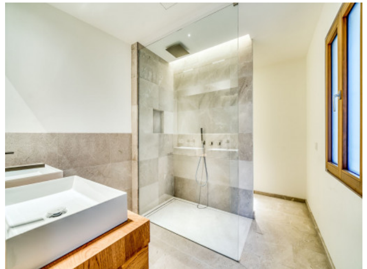
Uno de 2 baños