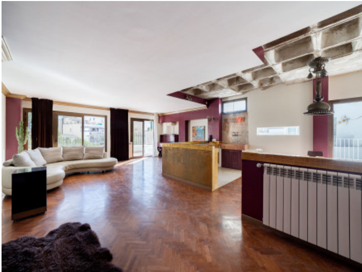
Salón-comedor abierto con cocina