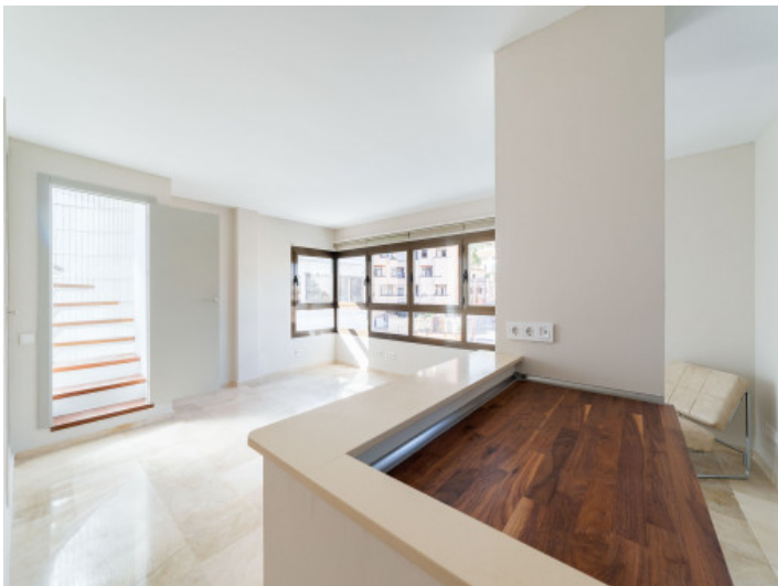
Salón con cocina