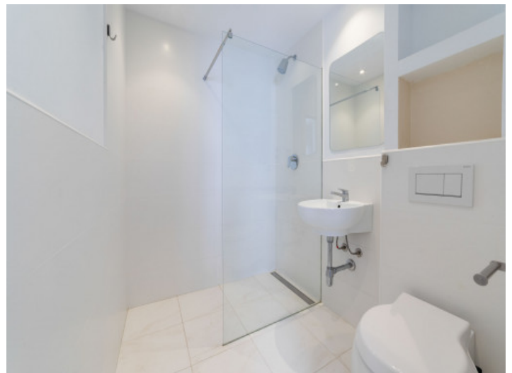
Baño con ducha

Toda la información como mejor se puede saber, salvo por error durante el periodo de venta. Sirva este documento como un informe previo, las bases legales solo serán válidas a través de un contrato de compra acordado ante Notario.