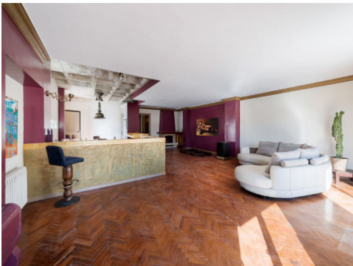
Vista alternativa al salón