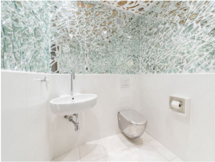
Baño de huéspedes