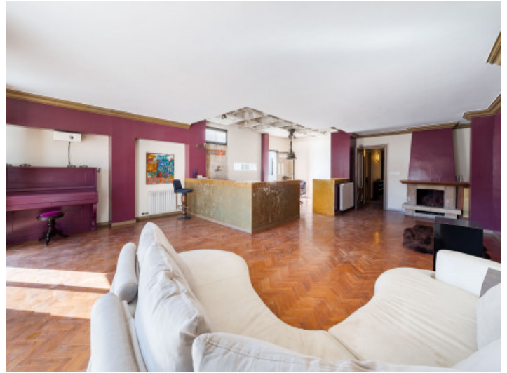
Salón-comedor abierto con cocina del segundo piso