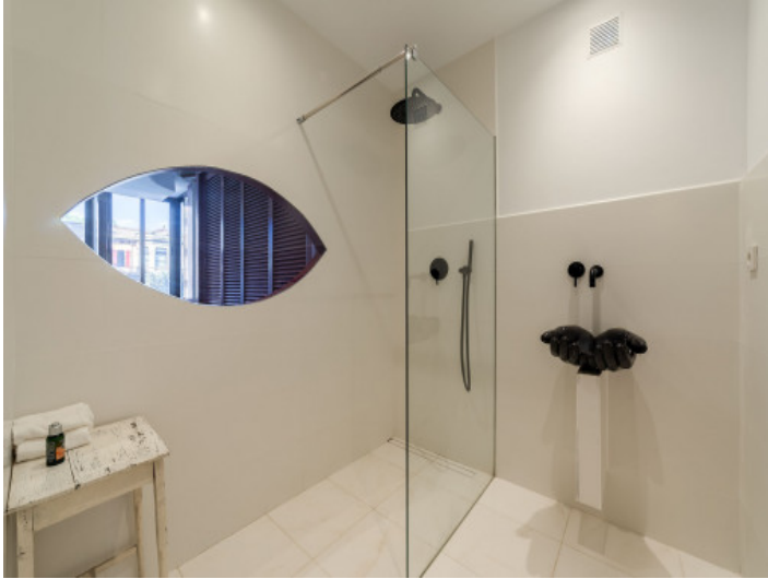
Baño con ducha