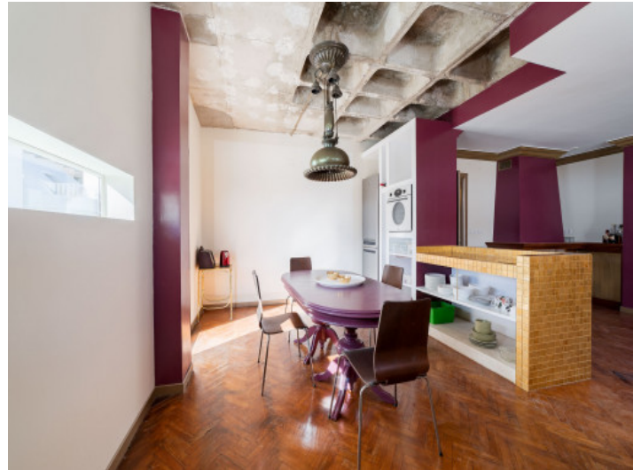
Vista al comedor