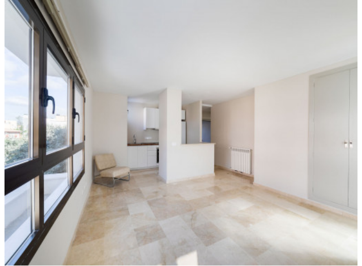
Salón primero piso