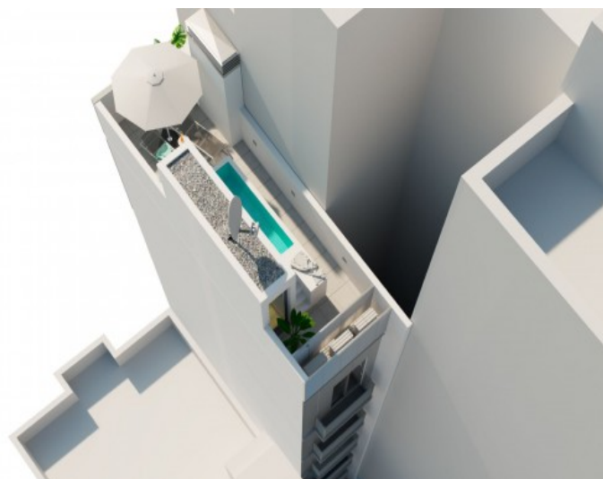
Vista desde arriba