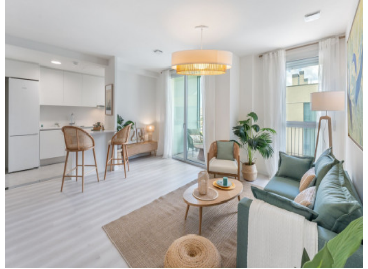
Salón en estilo moderno