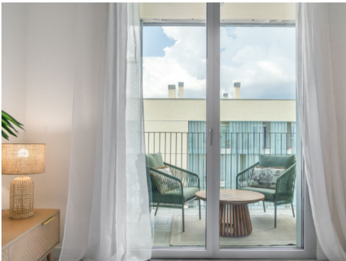
Acceso al balcón