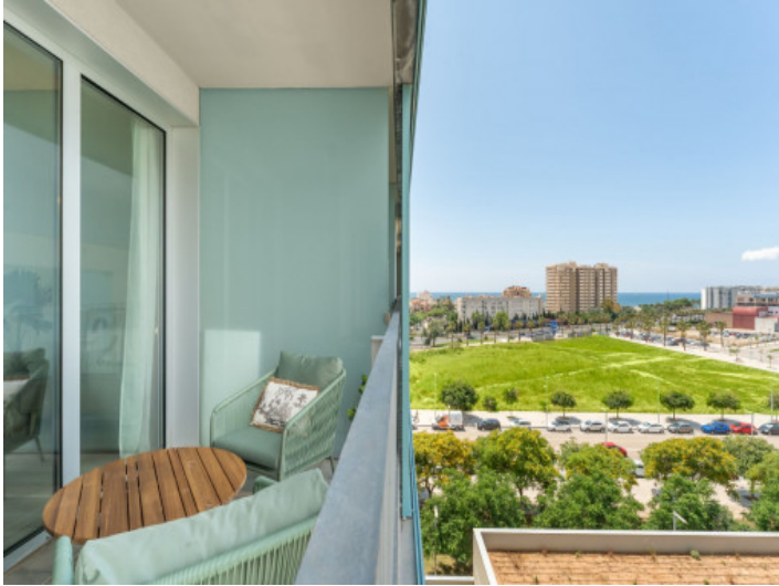
Balcón con vistas al mar